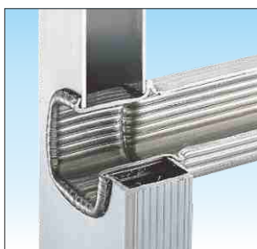
Piolo mm. 30 x 30 fissato con bordatura interna ed esterna