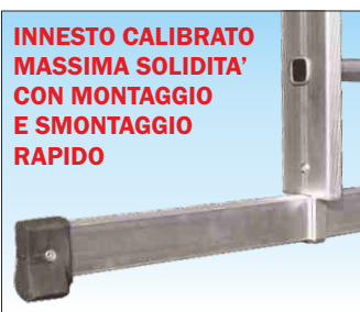
Basetta stabilizzatrice in alluminio ad innesto calibrato indeformabile; consente il montaggio e lo smontaggio rapido

N.B. Articoli SCA 3060N/16V utilizzano profilo 95x25R alettato rinforzato in lega 6005 e bloccaggio tronchi con saltarello professionale automatico in acciaio zincato