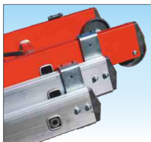
Cerniere di sfilo tronchi in acciaio zincato con cuscinetti in gomma

N.B. Articoli SCA 3060N/16V utilizzano profilo 95x25R alettato rinforzato in lega 6005 e bloccaggio tronchi con saltarello professionale automatico in acciaio zincato