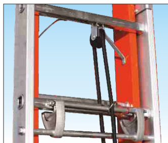
Sfilo tronchi a monocorda su carrucola e bloccaggio con bilanciere automatico in alluminio anti-ruggine.