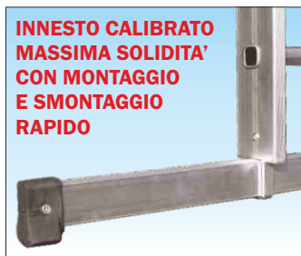
Basetta stabilizzatrice in alluminio ad innesto calibrato indeformabile; consente il montaggio e lo smontaggio rapido

N.B. Articoli SCA 3051N/18V utilizzano profilo 95x25R alettato rinforzato in lega 6005 e bloccaggio tronchi con saltarello professionale automatico in acciaio zincato