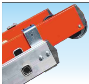
Cerniere di sfilo tronchi in acciaio zincato con cuscinetti in gomma

N.B. Articoli SCA 3051N/18V utilizzano profilo 95x25R alettato rinforzato in lega 6005 e bloccaggio tronchi con saltarello professionale automatico in acciaio zincato