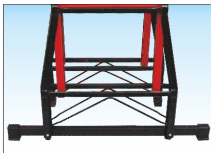
Base rinforzata con tralicciatura resistente agli urti e dotata di basetta stabilizzatrice smontabile