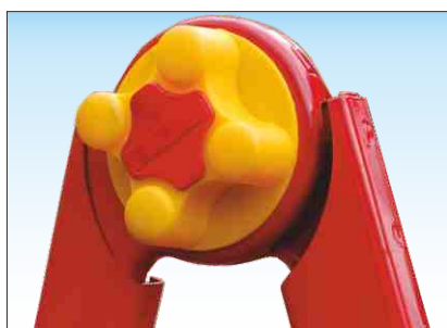
Cerniera a dischi dentati realizzata in acciaio verniciato con serraggio manuale mediante pomello a vite realizzato in plastica rinforzata

Ideale per lavori di piccola manutenzione, si adatta a svariati usi «Fai da Te». Con sfilo telescopico permette di compensare anche forti dislivelli. Risolve problemi di trasporto con ingombri minimi quando richiusa.