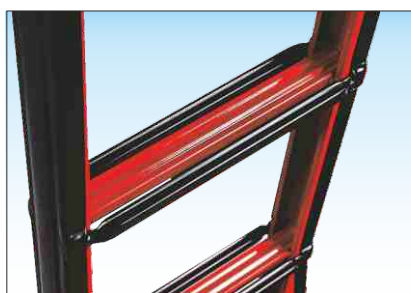
Robusti pioli in acciaio verniciato con profonda zigrinatura anti-scivolo