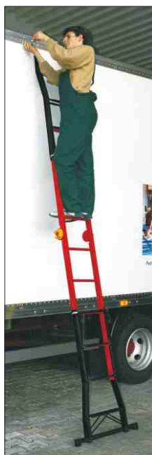
Scala in posizione estesa