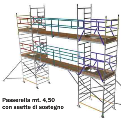
Passerella mt. 4,50 con saette di sostegno