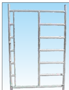
Montante di passaggio