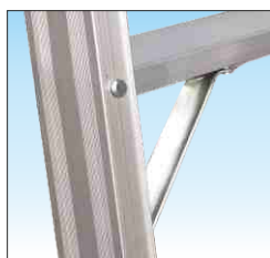
Gradino 40 mm. con nervature anti-urto in acciaio zincato