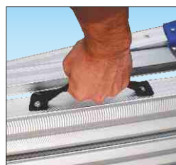
Cintino in nylon per maniglia trasporto