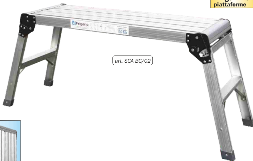
art. SCA BC/02