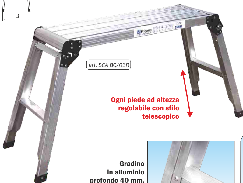
art. SCA BC/03R

Ogni piede ad altezza regolabile con sfilo telescopico