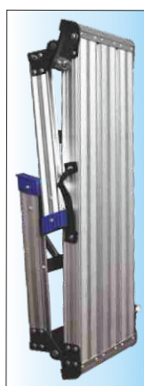
Ripiegabile per il trasporto