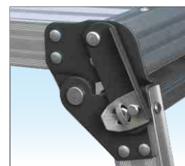
Gancio anti-chiusura in acciaio verniciato