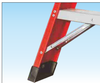
Base rinforzata con doppie nervature anti-urto realizzate in acciaio zincato