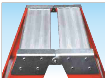
Cerniera in acciaio zincato con ripiano superiore dimensioni mm. 200 x 300