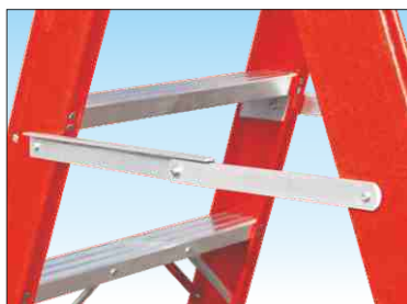
Barre distanziatrici di sicurezza anti-chiusura e anti-divaricamento ad apertura automatica in alluminio anti-ruggine