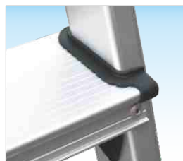
Gradino piano profondo mm. 80 con zigrinatura anti-scivolo