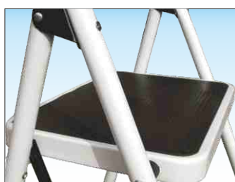
Ampi gradini con chiusura a scomparsa in acciaio verniciato ricoperti in gomma