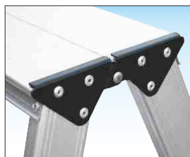
Ripiano terminale cm. 18 x 33 con cerniera in acciaio zincato