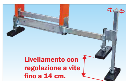
Basetta telescopica con chiusura a scomparsa e piedi basculanti che si adattano al terreno; dotata di n° 1 piede livellatore in acciaio zincato con regolazione a vite che può essere montato e smontato all'occorrenza per colmare pendenze o dislivelli con facilità e precisione

Basetta stabilizzatrice a scomparsa si richiude con sfilo telescopico