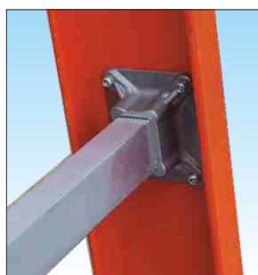
Piolo anti-scivolo in alluminio dimensioni 35 x 20 mm.