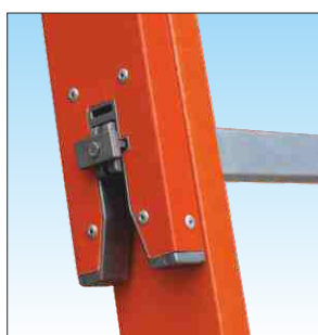
Anti-sfilo tronchi in alluminio ad attivazione manuale: garantisce un collegamento sicuro tra gli elementi scala

Una scala componibile capace di grande estensione che contiene l'ingombro per essere trasportata con facilità e leggerezza, è realizzata con profili montanti in vetroresina è idonea per uso con tensione elettrica non superiore a 1000V non sporca le mani, ed è particolarmente indicata per manutenzioni sulla rete telefonica.