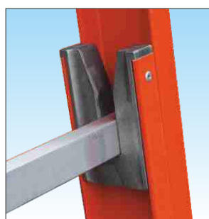
Spinotto d'innesto in alluminio indeformabile che garantisce la massima tenuta e la lunga affidabilità nel tempo