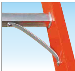
Estremità rinforzate con nervature anti-urto in acciaio zincato