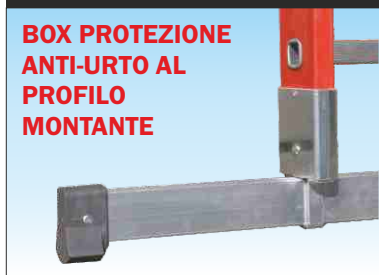
Basetta stabilizzatrice in alluminio con box di protezione profilo che permette il montaggio e lo smontaggio rapido

BOX PROTEZIONE ANTI-URTO AL PROFILO MONTANTE