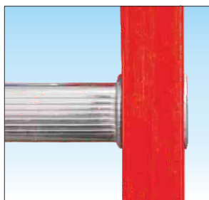
Attacco piolo-montante a doppia bordatura, interna ed esterna