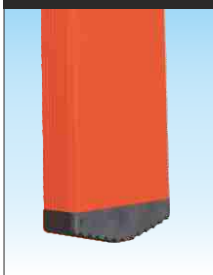
Piedino di appoggio fissato con innesto anti-distacco