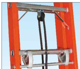
Sfilo tronchi a monocorda su carrucola e bloccaggio con bilanciere automatico in alluminio anti-ruggine

Certificata EN 131 con sviluppo fino a 9,53 mt. SENZA l'uso di rompi-tratta !