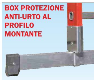
Basetta stabilizzatrice in alluminio e box di protezione profilo: permette il montaggio e lo smontaggio rapido