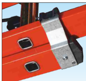
Cerniere di sfilo tronchi in robusto profilato di alluminio anti-ruggine