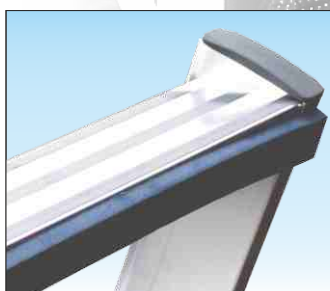
Appoggio su superfici pregiate

Con nervature di rinforzo in alluminio anti-ruggine saldate contro gli urti laterali e dotata di piedini ad innesto che evitano il distacco accidentale