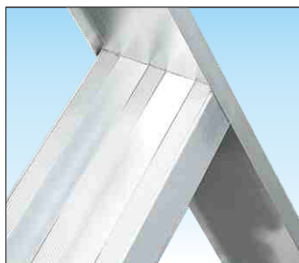
Gradini profondi 83 mm. molto robusti saldati su spessori maggiorati

Una soluzione pratica e sicura, dotata di gradino piano per una maggiore comodità. La massima stabilità è garantita da una solida base appositamente allargata. La superficie di appoggio anti-graffio permette l'uso anche su superfici pregiate.