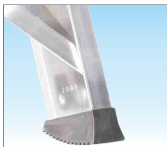
Base rinforzata con nervature anti-urto e piedini ad innesto anti-distacco

Unito al montante verticale mediante robusta saldatura ad angolo nascosta alla vista a garanzia della massima stabilità e di lunga affidabilità nel tempo