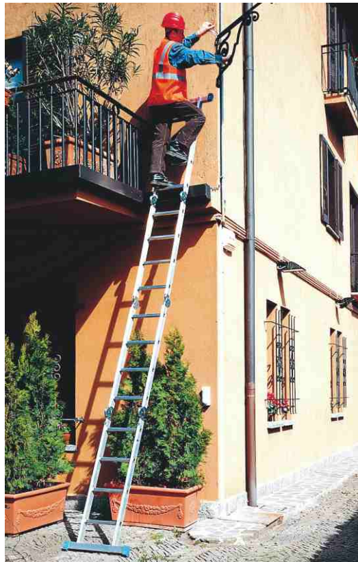
In foto articolo SCA 3043/4