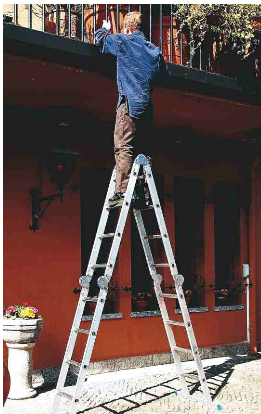
In foto articolo SCA 3043/4