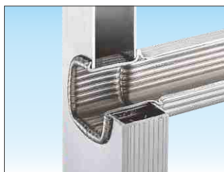
Attacco piolo-montante con doppia bordatura interna ed esterna