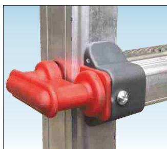
Regolazione altezza piano mediante ganci in acciaio rivestiti in nylon

Piattaforma maggiorata ! con larghezza di 55 cm.