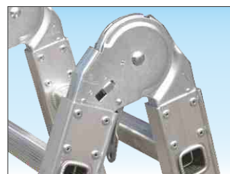
Cerniere in acciaio ad arresto automatico e sblocco rapido